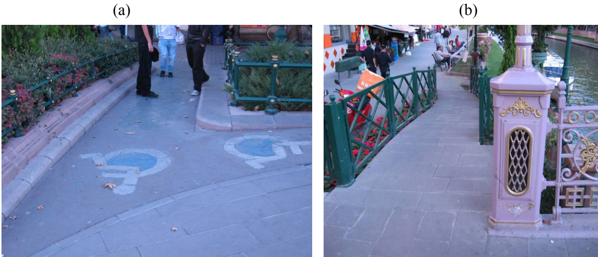
Şekil 8. Engelliler için tasarlanmış yol, köprü ve kaldırımlar

Eskişehir ilinde bulunan, gerek yol gerekse kaldırımların tümünde engelliler için iniş ve çıkış rampaları düzenlenmiştir. Şehrin sembolü olan Porsuk nehri üzerinde bulunan köprülerden engelli vatandaşlar kolaylıkla geçişlerini sağlayabilmektedirler. Ayrıca görme engelli kullanıcılar için sinyalizasyon kavşaklarda sesli sistemler kullanılmaktadır. Bunun yanında görme engelli kullanıcılar için kaldırım köşeleri özellikle kabartmalı şekilde tasarlanarak, görme engellilerin buldukları yerleri belirlemelerine olanak sağlanmıştır. Bu yapılan çalışma örnekleri Şekil 8’ de verilmiştir.