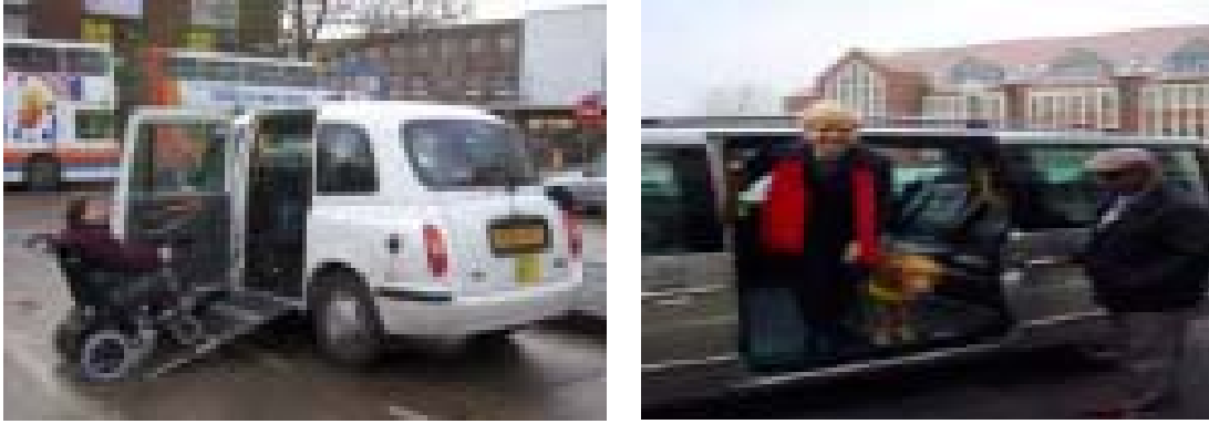
Őekil 2. Bedford kenti uygulamaları

D¼nyanın birok kentinde engelli kullanıcıların yařamlarını kolaylařtırmak amacı ile ulařım konusunda çeřitli alıřmalar gerekleřtirilmektedir. Őekil 2 ve 3' de İngiltere' nin Bedford kentinde uygulanan alıřmalar g¼sterilmiřtir[4].