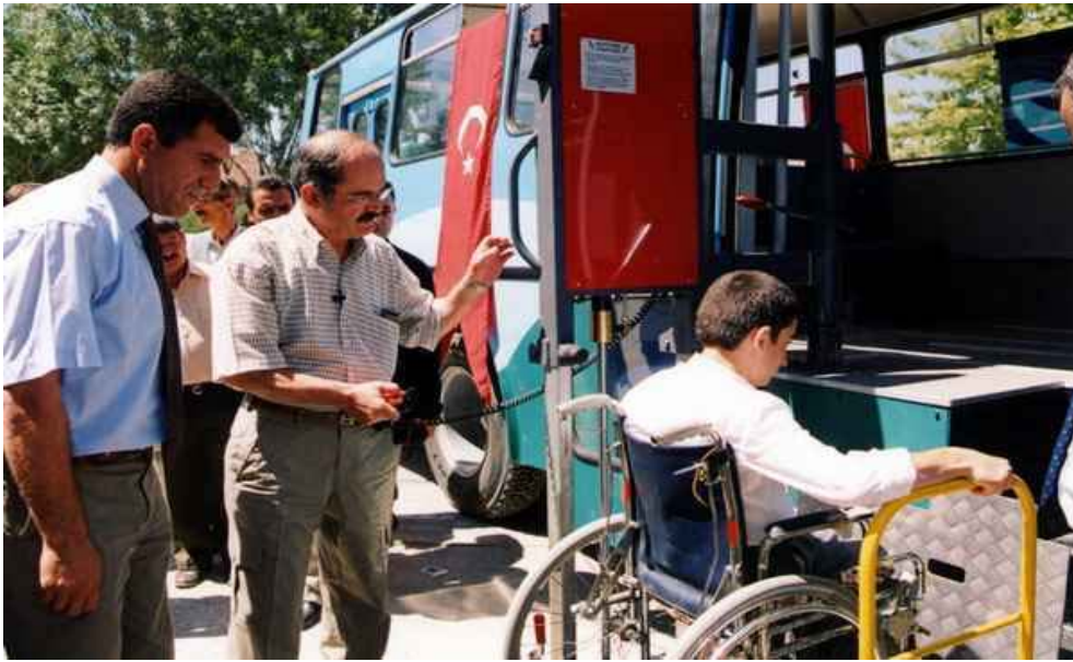
Şekil 6. Engelliler için tasarlanmış taşıt

Engelli kullanıcıların ulaşım sorunlarını gidermek, kentteki yaşamlarını kolaylaştırmak, sabah ev-iş ve ev-okul yolculukları için otobüs servisleri düzenlenmiştir. Servisler sabah 06.00 da başlayıp akşam 23.00'e kadar devam etmektedir. Şekil 6' da verildiği üzere, taşıma araçları engelli kullanıcıların, taşıta binmelerini kolaylaştıracak donanıma sahip olacak şekilde tasarlanmıştır.