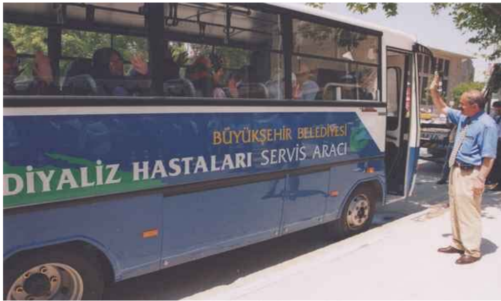
Şekil 4. Diyaliz hastaları için taşıma hizmeti

Yerel yönetimler öncelikle engelli vatandaşların ulaşım ihtiyaçlarını mümkün olduğunca karşılamak zorundadır. Bu amaçla Eskişehir ilinde yaşayan diyaliz hastaları için özel servis aracı tahsis edilmiştir. Hastalar belli güzergahlar dahilinde evlerinden alınarak, diyaliz merkezlerine götürülmekte ve tedavileri tamamlandıktan sonra evlerine bırakılmaktadır. Şekil 4 ve 5' te görüleceği üzere her gün yaklaşık 50 diyaliz hastasına hizmet verilmektedir. Servis sabah 05.00 te başlayarak, gece 23.00' te sona ermektedir. Günlük 3 servis söz konusudur.