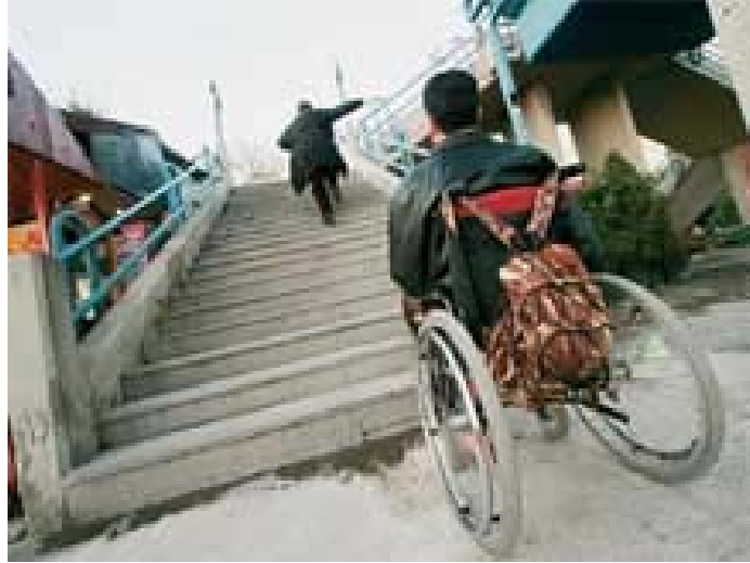
Şekil 1. Engelli olmak

Engellilerin topluma katılmalarının önündeki en büyük engellerden biri de ulaşım, fiziksel çevre ve konut sorunudur. Engellilerin içinde yaşadıkları fiziksel çevre, sahip oldukları fiziksel işlev bozuklukları/yetersizlikleri ve bunun yol açtığı sınırlamalar yüzünden Şekil 1’ de verildiği üzere büyük önem taşımaktadır. Yaşanılan konuttan tüm kamusal yaşam alanlarına ve ulaşım araçlarına kadar tüm çevresel unsurların engellilerin özellikleri ve gereksinimleri dikkate alınarak tasarlanmadığı bir gerçektir. Yollar, kaldırımlar, kamu binaları, parklar ve bahçeler, okullar, içinde yaşanılan konutlar, ulaşım araçları ve bunun gibi daha birçok fiziksel çevre unsuru, engellilerin topluma katılmasının önünde ciddi birer engel oluşturmaktadır. Böylece sahip olduğu engeli nedeniyle hareket yeteneği sınırlanmış insanların bu ve benzeri sebeplerle yaşadıkları sınırlama daha da pekişmektedir. Yapılacak çalışmalar ile bütün bunlar, engellilerin topluma katılmasını, toplumla bütünleşmesini kolaylaştıracak bir biçimde tasarlanabilir ve geliştirilebilir.