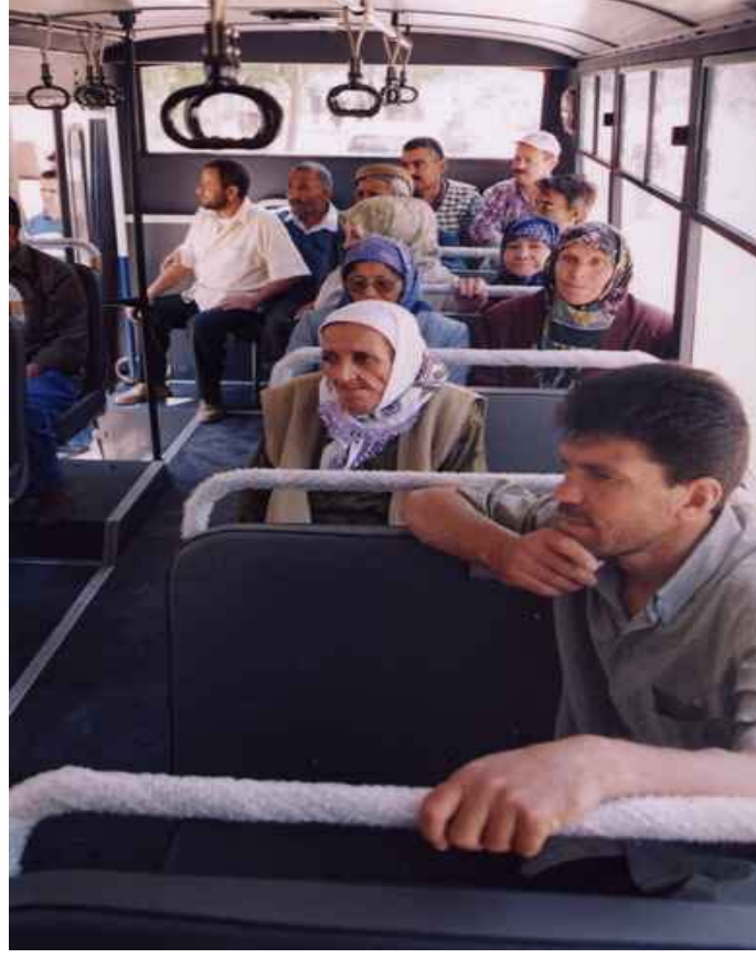
Şekil 5. Diyaliz hastaları için taşıma hizmeti

Engelli kullanıcıların ulaşım sorunlarını gidermek, kentteki yaşamlarını kolaylaştırmak, sabah ev-iş ve ev-okul yolculukları için otobüs servisleri düzenlenmiştir. Servisler sabah 06.00 da başlayıp akşam 23.00'e kadar devam etmektedir. Şekil 6' da verildiği üzere, taşıma araçları engelli kullanıcıların, taşıta binmelerini kolaylaştıracak donanıma sahip olacak şekilde tasarlanmıştır.