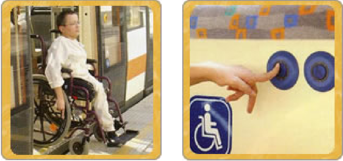
Şekil 7. Engelliler için tasarlanmış tramvay ve durak

Eskişehir ilinde, Şekil 7’ de gösterilen hafif raylı sistem kullanılmaktadır. Tramvay durakları engelli kullanıcıların tramvaya kolaylıkla girebileceği şekilde tasarlanmıştır. Tramvay içinde engelliler için, emniyet kemerli özel bölüm bulunmaktadır.